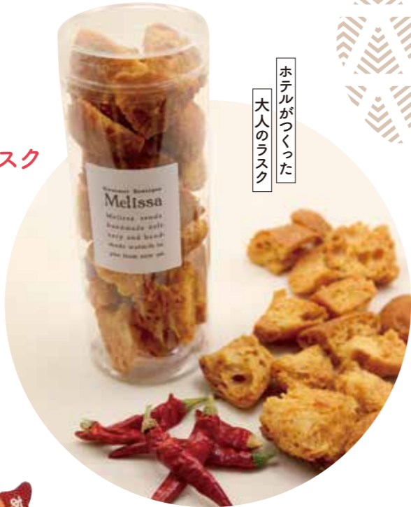
ホテルがつくった 大人のラスク

江戸東京野菜に認定されている内藤とうがらしを使ったラスクを、リーガロイヤルホテル東京が発売。バター豊かな風味とピリリとマイルドな辛みがあとをひき、手が止まりません。