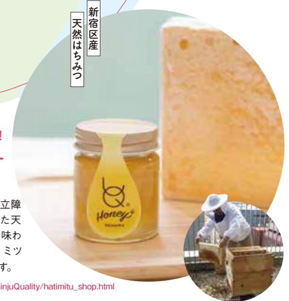
新宿区産 天然はちみつ

販売店 http://www.sksc.or.jp/shinjuQuality/hatimitu_shop.html