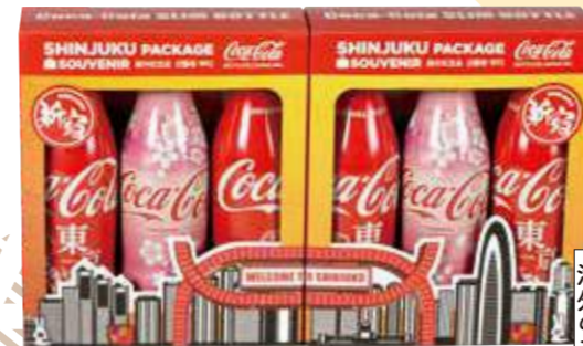
海外のお客さん にも大人気

新宿のランドマークやモニュメントを描いたオリジナルBOX入りコカ・コーラを、新宿観光案内所で発売中。BOXは2種類あり、並べると新宿の街並みが完成します。