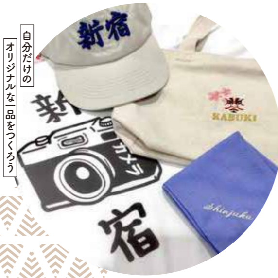
自分だけの オリジナルな一品をいこう