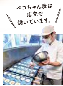
ぺこちゃん焼は 店先で 焼いています。

ぺこちゃん焼が買えるのは、神楽坂にある不二家だけ。定番のあずきやカスタードのほか、季節や月ごとのメニューもあり選ぶのが楽しい!