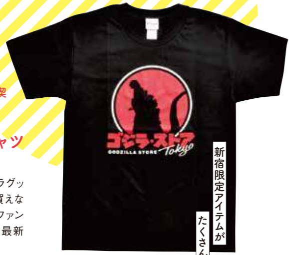
新宿限定アイテムが たくさん

東宝が公式で運営するゴジラグッズ専門ショップ。ここでしか買えない限定グッズが多数そろい、ファンにはたまりません。ゴジラの最新情報も発信します。