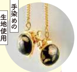
手染めの 生地使用